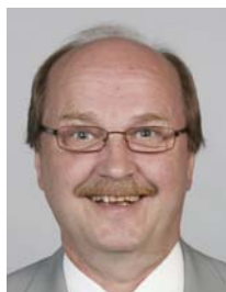
2) не правильно