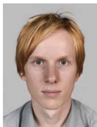
5) не правильно