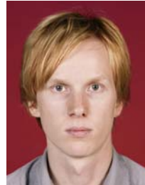
4) не правильно темный фон