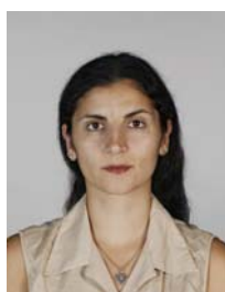
4) не правильно слишком далеко