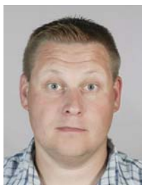
3) не правильно