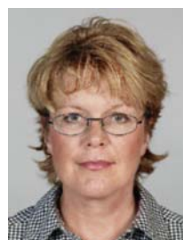
8) не правильно