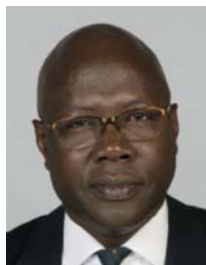
4) не правильно