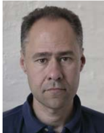
2) не правильно неоднотонный фон