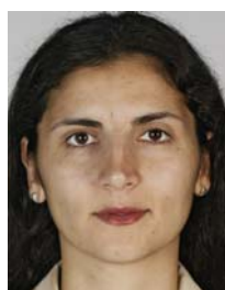
5) не правильно слишком близко