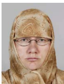
6) не правильно