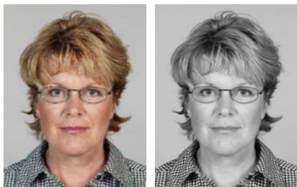
1) правильно 2) правильно

На этой странице излагаются требования к личной фотографии на паспорт, касающиеся основных параметров фотографии и других общих характеристик.