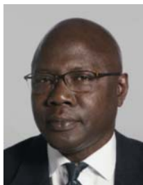
3) не правильно