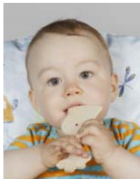
6) не правильно игрушка, на фоне -- подушка