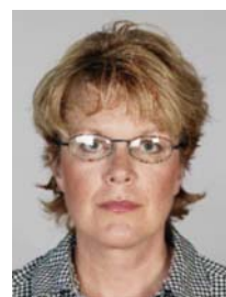
9) не правильно