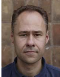
3) не правильно узорный фон