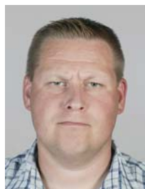
4) не правильно