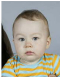
7) не правильно изображение постороннего лица