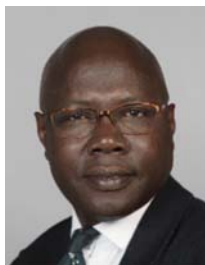
2) не правильно