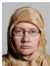
7) не правильно