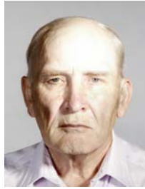
2) не правильно яркая точка на лбу