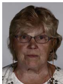
6) не правильно с недостаточной выдержкой