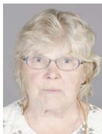
5) не правильно передержанный снимок