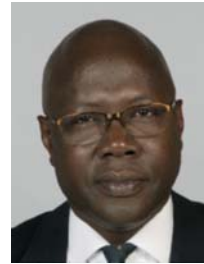
4) не правильно