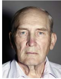
3) не правильно освещение сбоку / тень