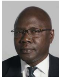
3) не правильно